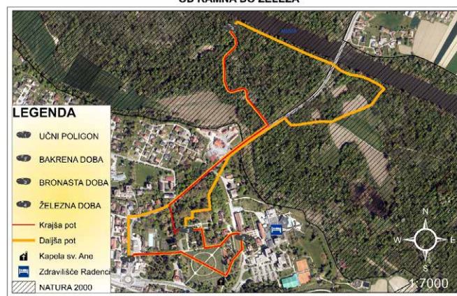
OD KAMNA DO ŽELEZA

Prijavna dokumentacija in podrobnejše informacije na: https://www.energetika-portal.si/javne-objave/arhiv-energetika/javni-razpisi/r/javni-razpis-za-sofinanciranje-nakupa-in-postavitve-naprav-za-proizvodnjo-elektricne-energ-1206/