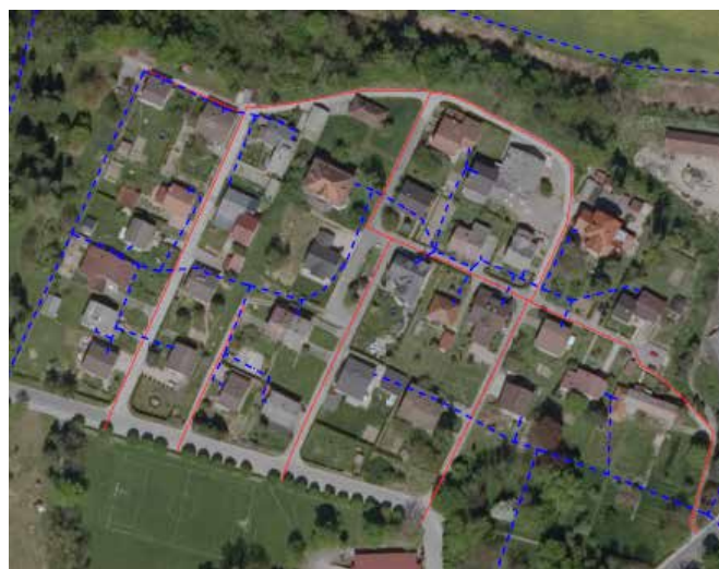
Legenda: ----- Projektiran vodovod ----- Obstoječi vodovod

V sklopu ureditve vodovodnega in kanalizacijskega omrež-ja se bo na območju obdelave izvedel tudi zaključni sloj s