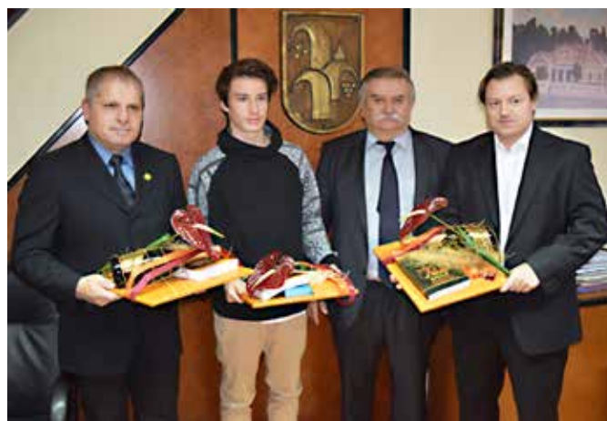
Sprejem pri županu